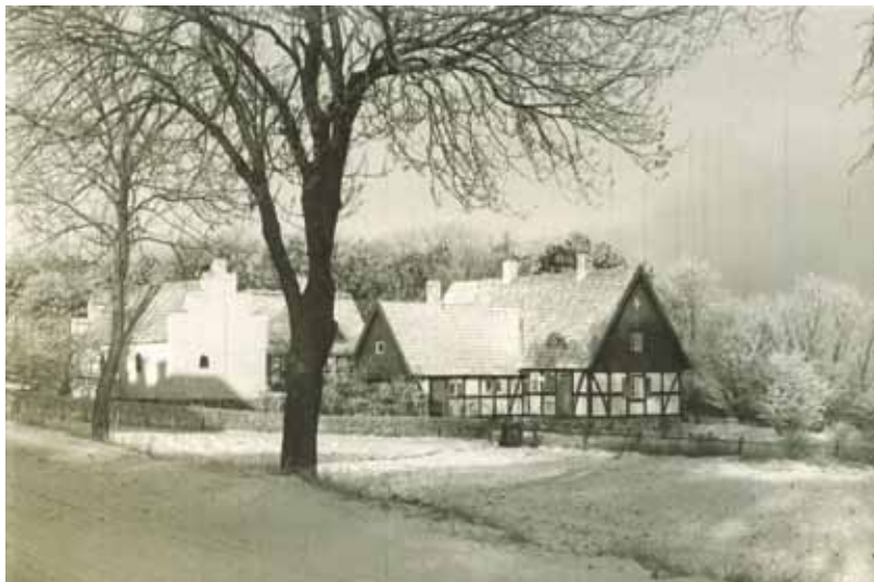
Arild med alla byggnaderna efter 1936

Hellre ville jag sitta här och följa våren och sommaren än jaga ute i den tröttsamma världen. Man har ju böcker och bilder, man kan ju sedan i lugn och ro drömma sig det, man slipper jäktet, otrevnaden, längtan efter hemmets jord.