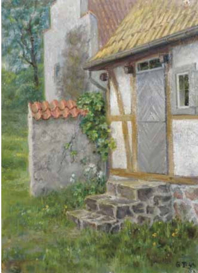
Arild med kapellet och ett av husen oljemålning 1944

därinne och sen räckte hon mig en krona och sade ”du ska taga denna och köpa ljus och bränna för mig ” ”Ja, sade jag, och jag ska bedja för dig.” – Och det var som om allt det hindrande föll, folkslag och tungomål, och tider och i full förståelse möttes våra själar i den eviga och heliga Kyrkans enhet. Hon grep min hand och kysste den.